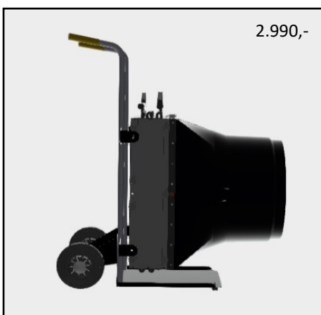
AgroHeat L 3R AgroHeat L 5R

For øvrige modeller i produktprogrammet, se vores katalog for dette produkt.